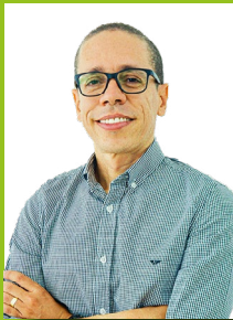
Pr. Fabrício Pacheco Segundas e Quartas, das 10h às 17h

Agende esse encontro previamente, na Secretaria, permitindo a melhor organização do tempo da equipe em suas atividades cotidianas. Telefone para contato/agendamento: (21) 2599-3000 ou pelo WhatsApp/Telegram: (21) 96811-4842.