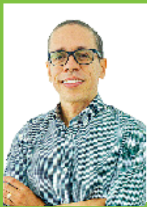
Pr. Fabrício Pacheco Segundas e Quartas, das 10h às 17h

Agende esse encontro previamente, na Secretaria, permitindo a melhor organização do tempo da equipe em suas atividades cotidianas. Telefone para contato/agendamento: (21) 2599-3000 ou pelo WhatsApp/Telegram: (21) 96811-4842.