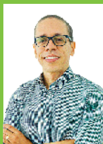
Pr. Fabrício Pacheco Segundas e Quartas, das 10h às 17h

Agende esse encontro previamente, na Secretaria, permitindo a melhor organização do tempo da equipe em suas atividades cotidianas. Telefone para contato/ agendamento: (21) 2599-3000 ou pelo WhatsApp/Telegram: (21) 96811-4842.